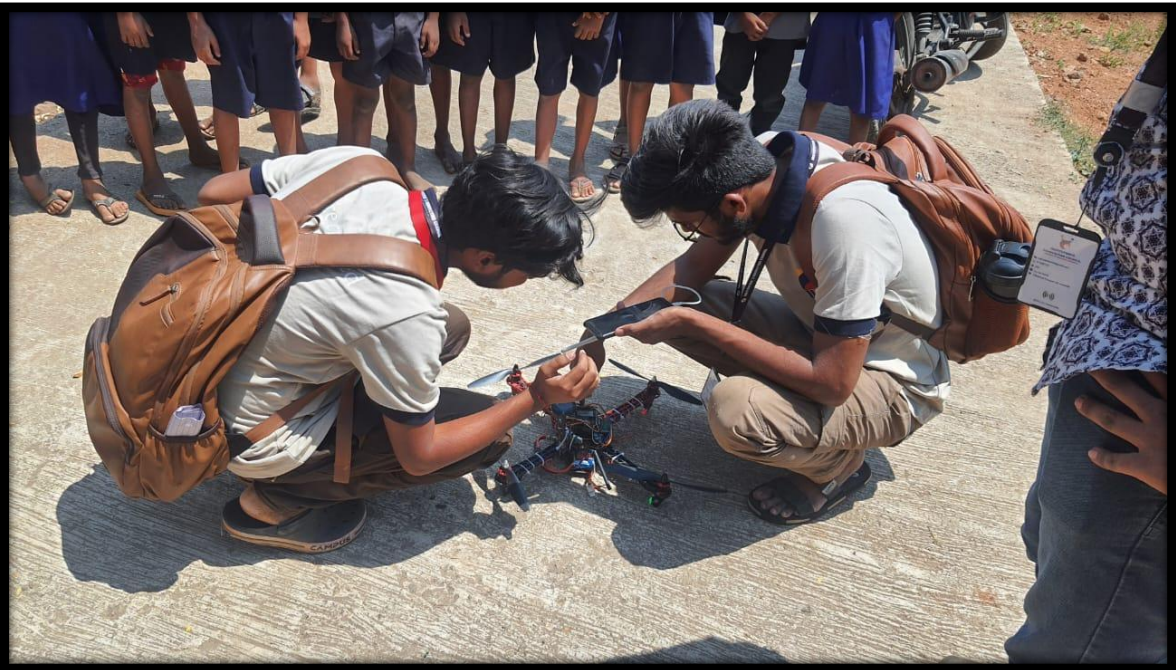
Calibrating the Drone