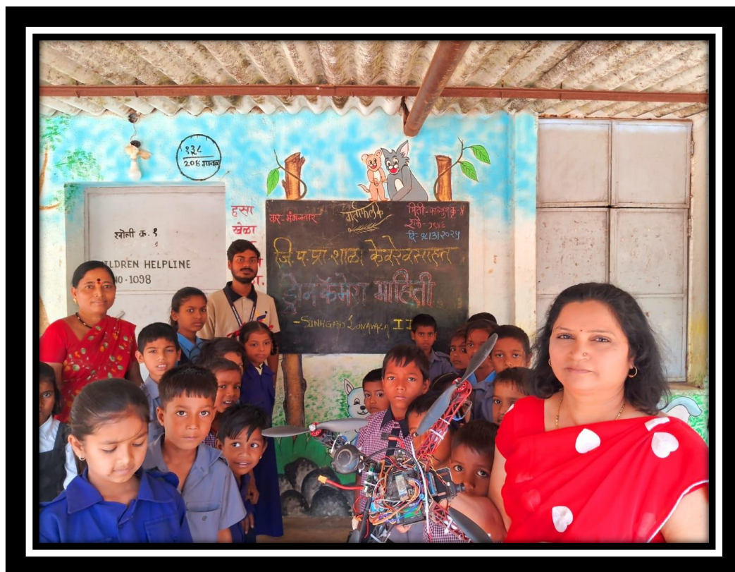
Students with drone.