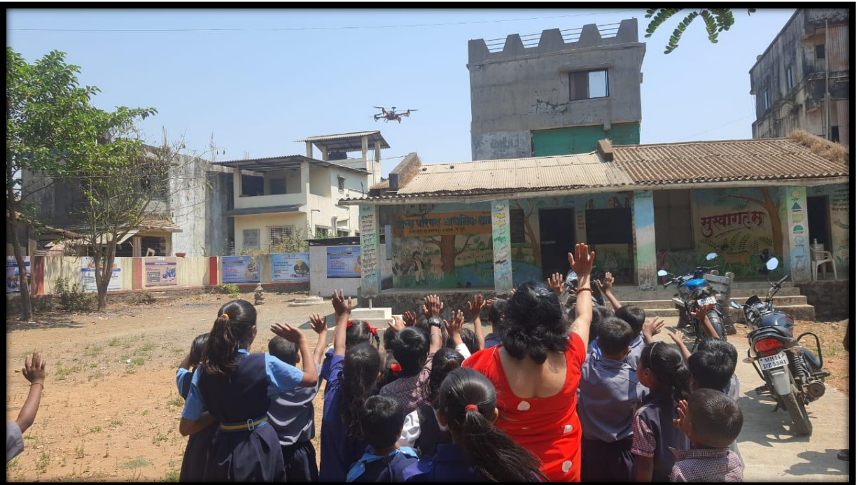
Students witnessing live demonstration.