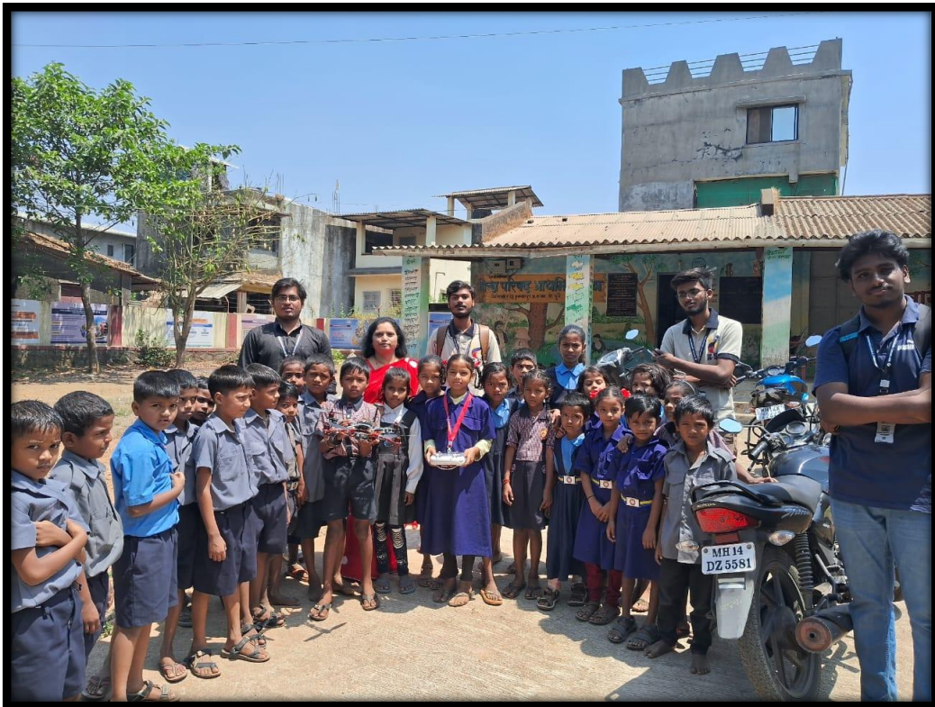
Group Photograph with school principal and students.